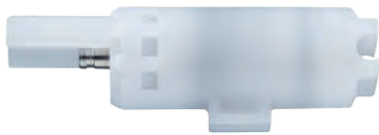
Ejemplo de aplicación 2.1