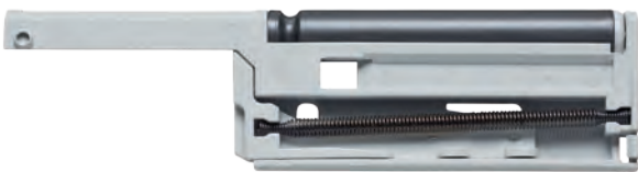
Ejemplo de aplicación 1.1